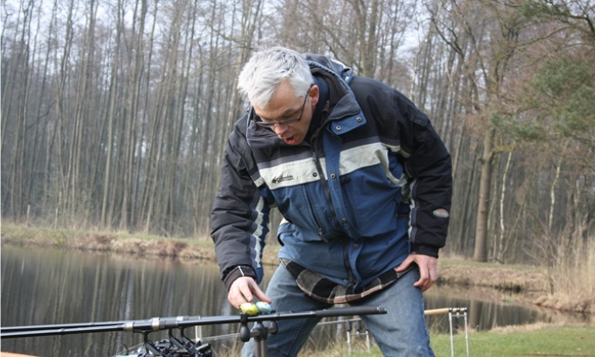
De lokale inwoners zijn ook betrokken bij het paasorgaan, ook tijdens onze "PaasCarp" sessie