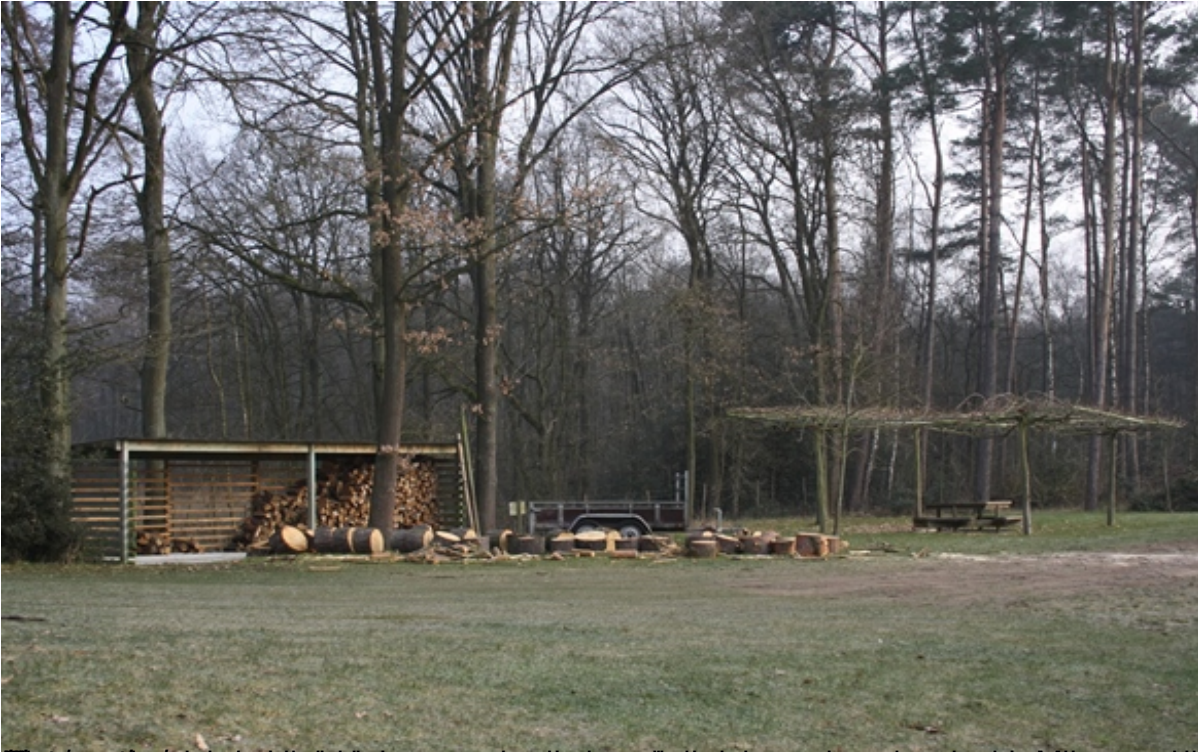
Wat voor de lokale inwoners is een groot feest om de lokale overheid te helpen met de berging van de berging...