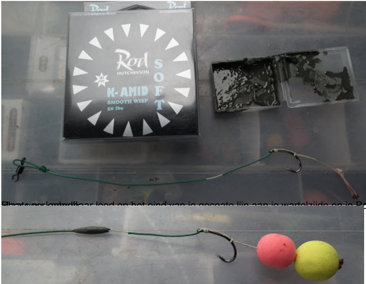
Elke voorkeur heeft haar leed en het eind van je gewenste lijn aan je wortelzijde en je Pop-Up rig is