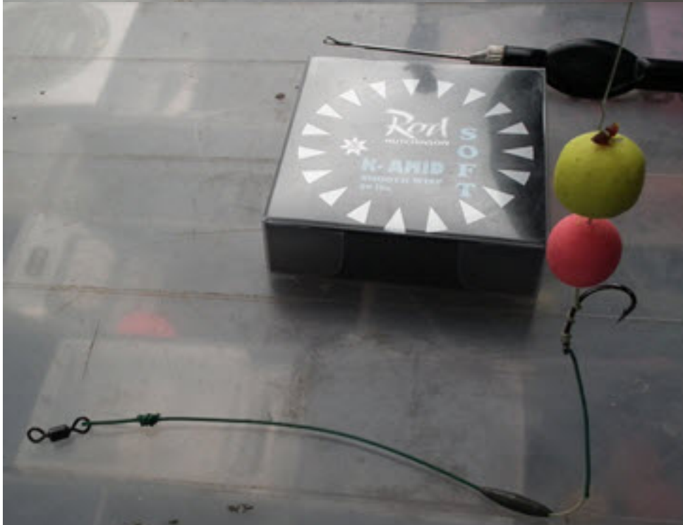
Deze multifunctionele rig heeft zo'n 10 miljoen al heel veel karper op de kant gekregen en ik weet