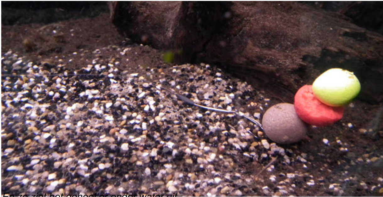
En zo ziet het geheel er onder water uit.