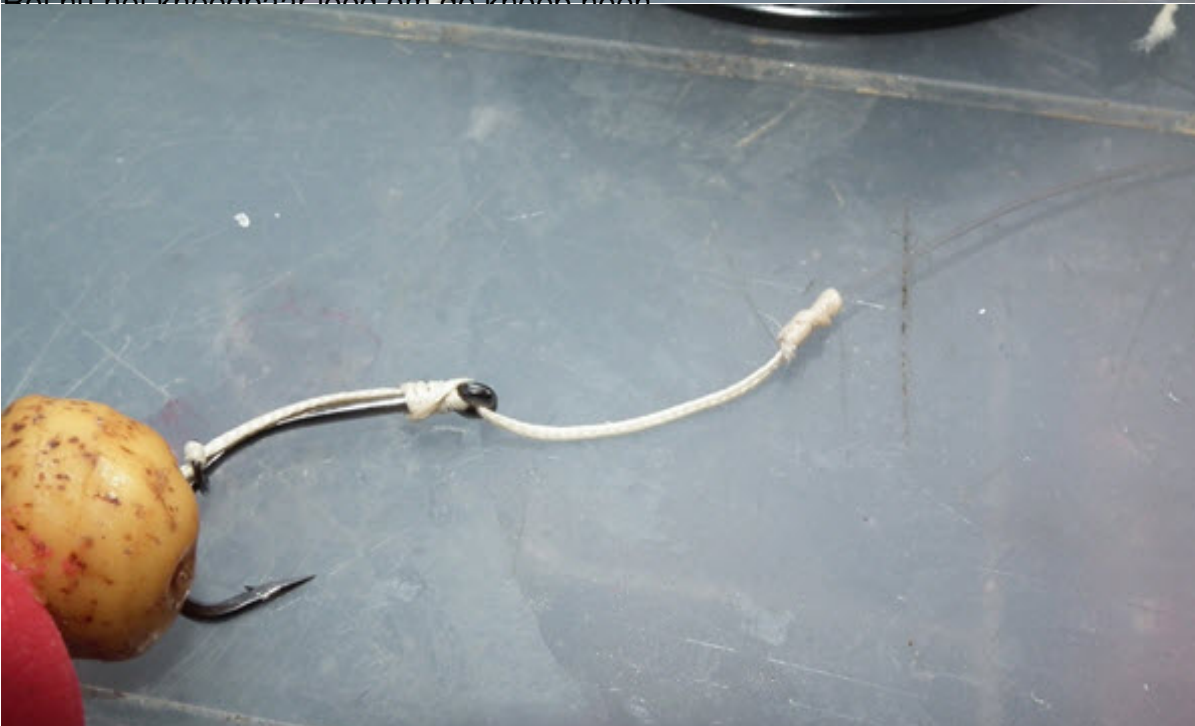
Gebruik het knoopbaar lood om de knoop heen te binden.