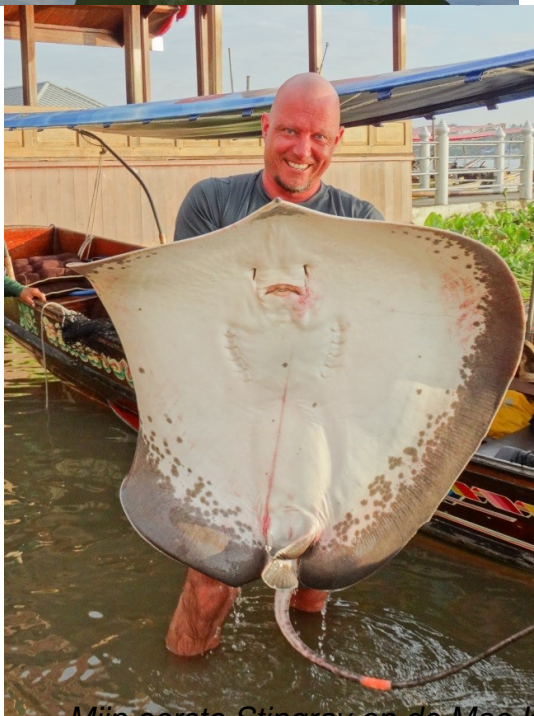
Mijn eerste Stingray op de Mae Klong Rivier 40 kg