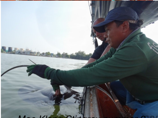
Mae Klom Stingray nummer 2 ☐☐☐☐ De Stinger van de Ray, scherp en gevaarlijk