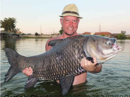
Catfish Shark Another Siamese Carp