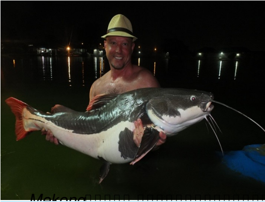
□□□□ Amazon Redtail