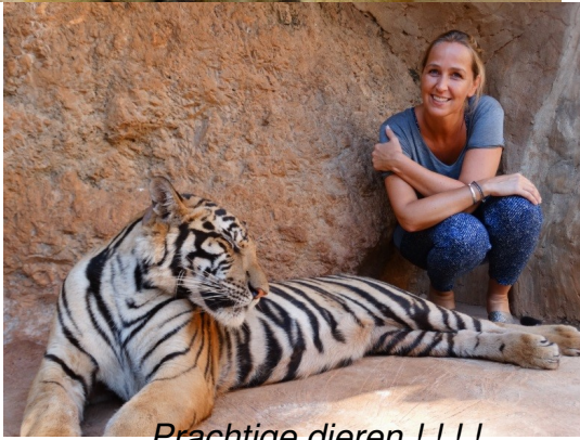
Prachtige dieren !!!