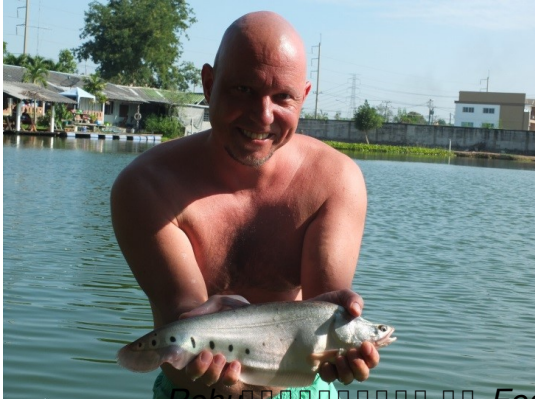
Featherback, een kleine maar mooie vis