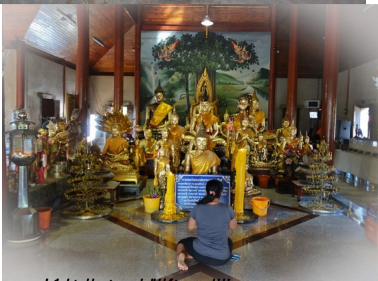
vangstetseweldigehijkaar maar o zo mooi wezen ☐☐☐☐☐☐☐☐☐☐ Schietgebedje voor goede