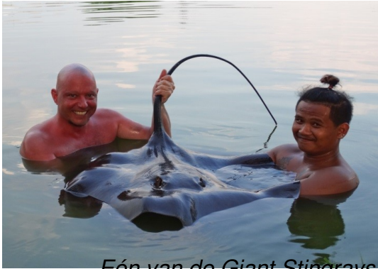
Eén van de Giant Stingrays op de vijver van 30 kg kunnen strikken