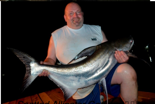
Spotted Alligator Gar Chao Praya Catfish