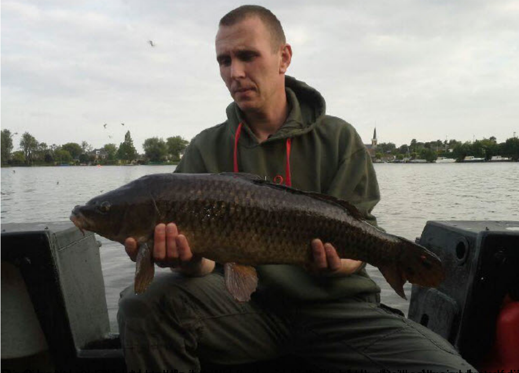
de lichtste goed