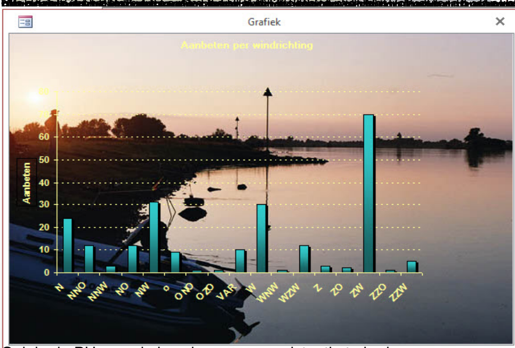
Ook in de PH waarde is enige vorm consistentie te herkennen.