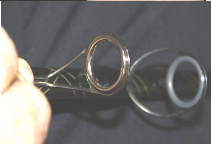
Deze reelhouder en deze ogen..... dát vind ik mooi!