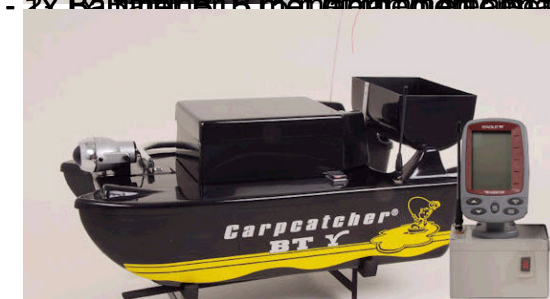
(zwart) Baitliner RT5 met diensmeter, lamp, voervijzel en accu-indicatie en afstandsbediening