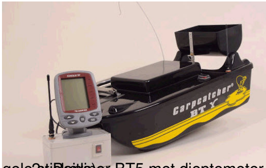
gele 2x Baitliner RT5 met diensmeter, voervijzel, 2 accu's, lamp en zonnepaneel (grijs/zwart met