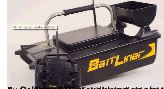
- 2x Baitliner RT5 met lichtoriëntatie en afstandsbediening (grijs/zwart) (zwarte gele stickers)