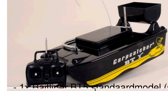
- 1x Baitliner RT5 standaardmodel (special paint grijs/zwart)