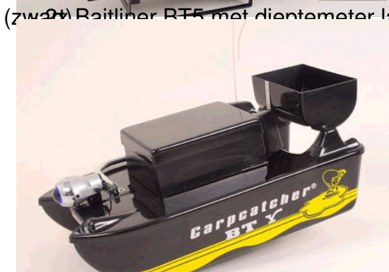
- 1x Baitliner BT5 met lamp, voervijzel en afstandsbediening (blauw/parelmoer)